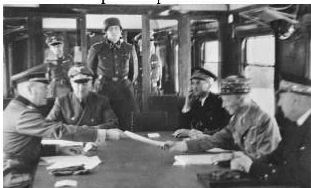
Капитуляция Германии 11 ноября 1918

11 ноября 1918 года первая мировая война 1914-1918 годов завершилась. Германия подписала полную капитуляцию. Произошло это под Парижем, в Компьенском лесу, на станции Ретонд. Капитуляцию принимал французский маршал Фош. Условия подписанного мира были следующими: