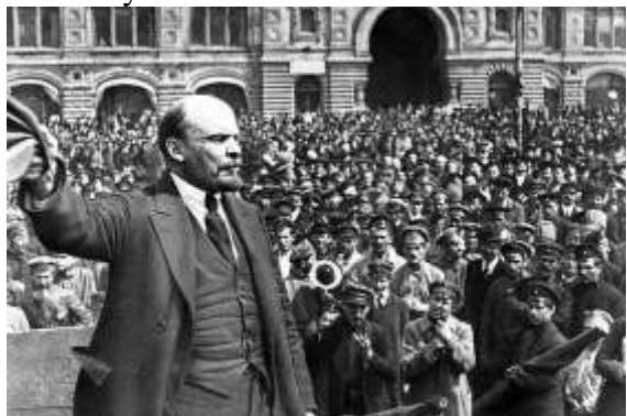
Декрет о мире

Русская армия, измотанная войной и потерями, не хотела воевать. Вопросы провианта, обмундирования и обеспечения припасами за годы войны так и не были решены. Армия воевала неохотно, но вперед продвигалась. Немцы были вынуждены вновь перебросить сюда войска, а союзники России по Антанте вновь изолировали себя, наблюдая за тем, что будет происходить дальше. 6 июля Германия перешла в контрнаступление. В его результате 150 000 русских солдат погибло. Армия фактически перестала существовать. Фронт развалился. Россия воевать больше не могла, и эта катастрофа была неминуема.